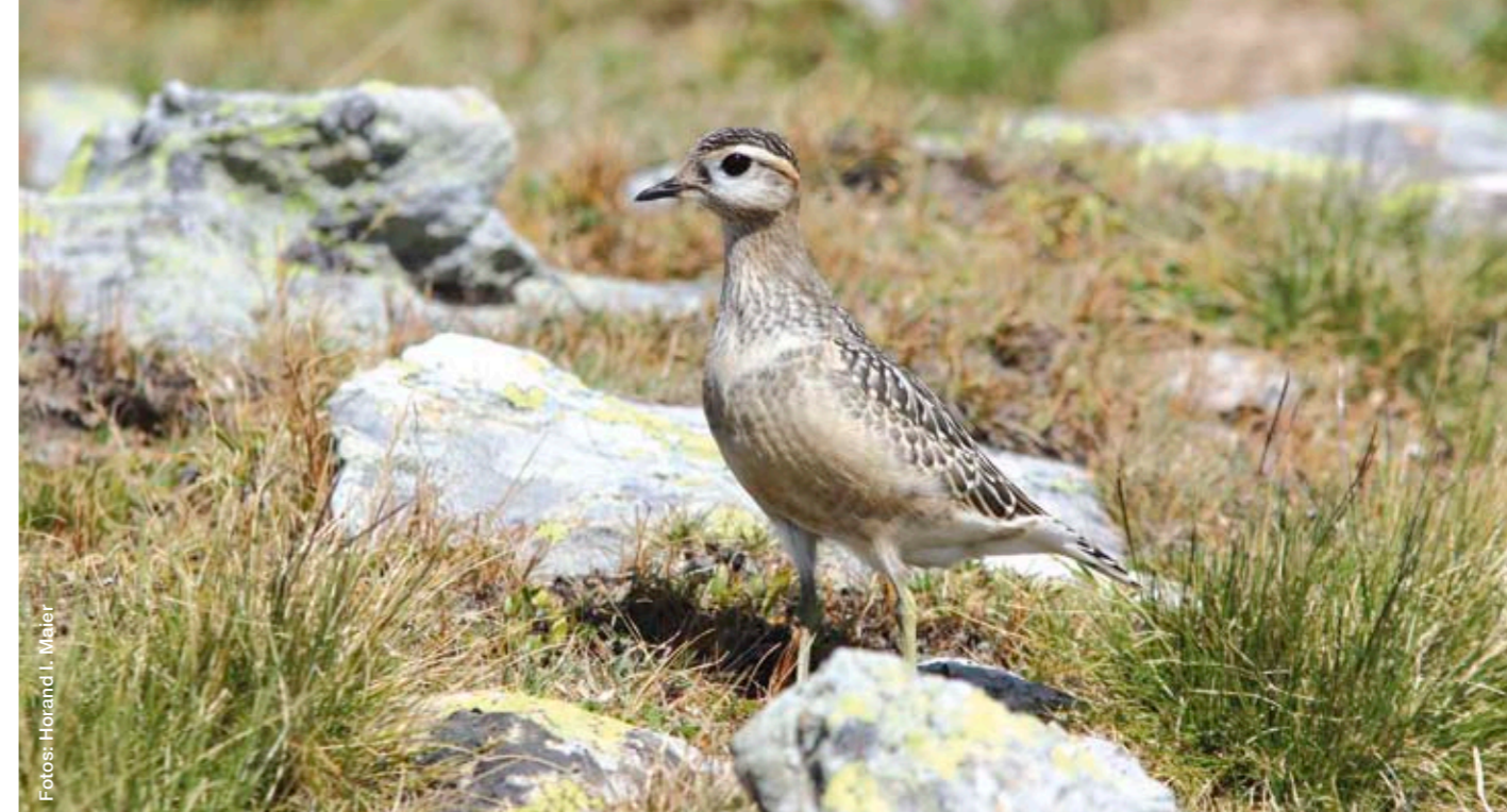
☑ Auf seinem Zug durch Südtirol bevorzugt der im Anhang I der Vogelschutzrichtlinie aufgelistete und im Tundragebiet heimische Mornellregenpfeifer als Rastplatz extensive Hochalmen u.a. mit Bürstlingsbewuchs.