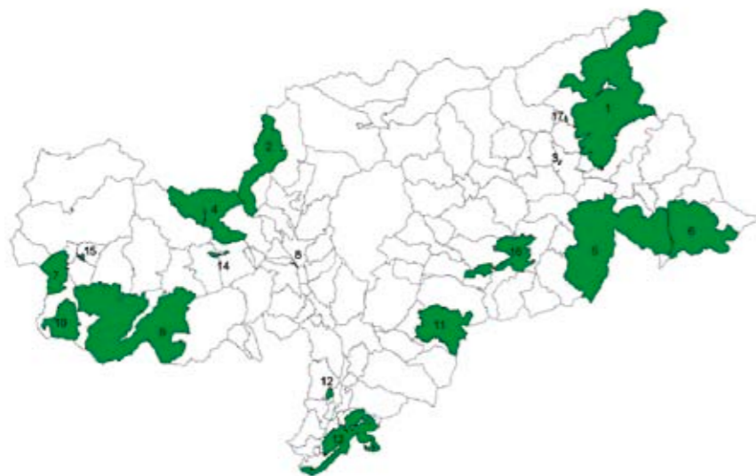
☑ Vogelschutzgebiete in Südtirol